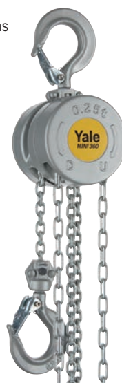
Capacité 250 kg