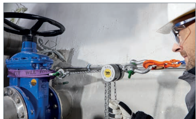
Application de tirage