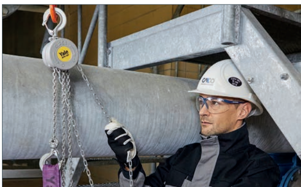
Application de levage