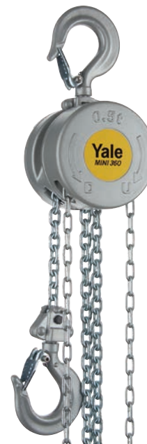
Capacité 500 kg