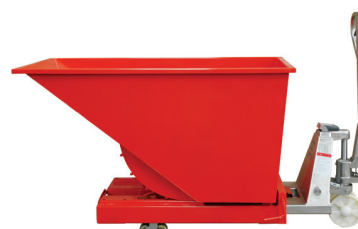
Déplacement manuel avec transpalette jusqu'à 1600 l