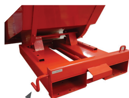
Déclenchement manuel ou réalisé directement du chariot élévateur à l'aide d'une chaîne ou d'un câble